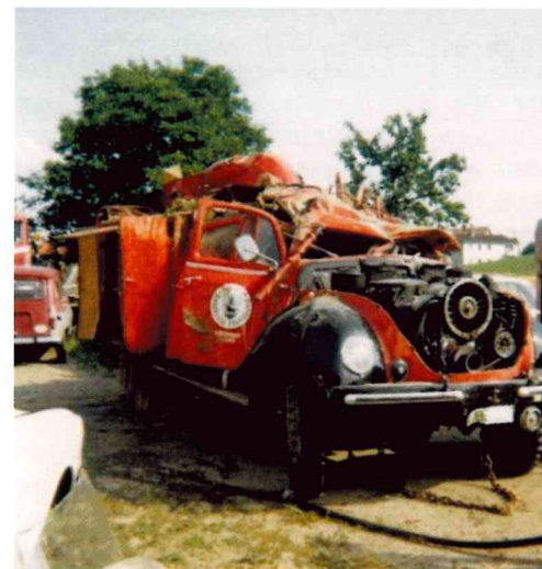
Das Unfallfahrzeug vom 01.08.1976