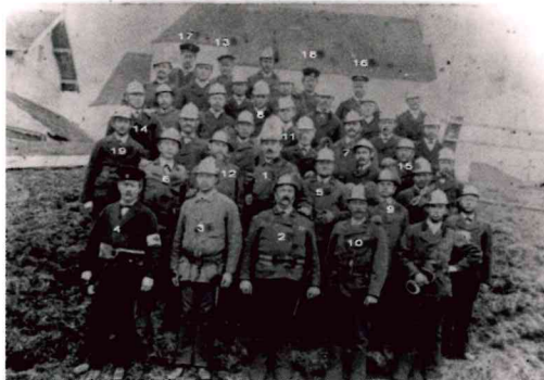
Eine Gruppenaufnahme der Glonner Feuerwehr, die wahrscheinlich zum 10jährigen Bestehen 1882 entstanden ist.

Die Scanzonis auf Zinneberg waren nicht nur Förderer des Glonner Vereinswesens, sondern im speziellen auch der Glonner Feuerwehr. So spendete Friedrich-Wilhelm von Scanzoni von 1872 bis zu seinem Tode 1891 der Glonner Wehr jährlich 50 Mark. Nicht nur dies, er gründete für den Gemeindeteil Zinneberg eine eigene Feuerwehr und schaffte für sie auch eine Saug- und Druckspritze an. Dieses Gerät diente auch dem übrigen Gemeindeteilen, was von den Glonnern bei der Meldung ihrer Ausrüstung immer wieder angeführt wurde. Die Ebersberger Amtsleute ließen dies wegen des langen Anfahrtsweges allerdings nicht gelten und verlangten für Glonn 1887 den Kauf einer Saug- und Druckspritze für 1800 Mark. Die Gemeinde lehnt mit der Begründung, man müsse erst ein Gemeindekrankenhaus (6000 Mark) bauen, erfolgreich ab.